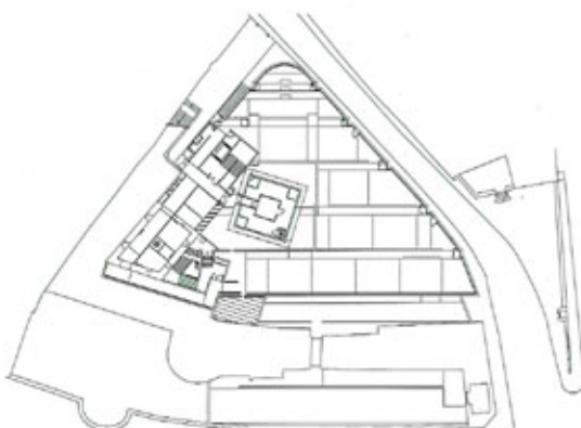
Plan du niveau inférieur.