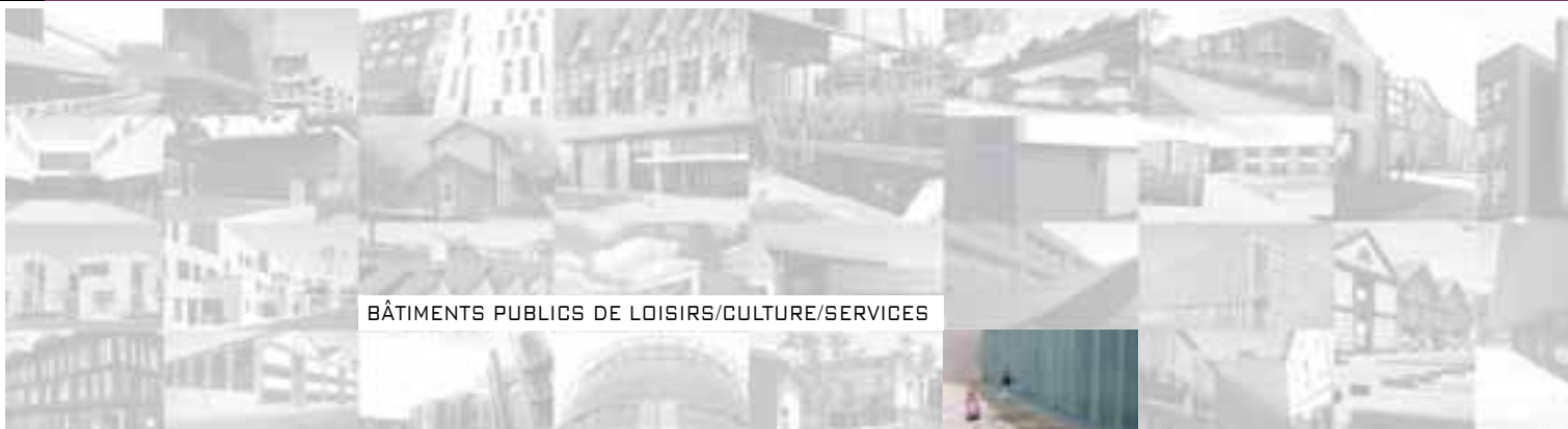
BÂTIMENTS PUBLICS DE LOISIRS/CULTURE/SERVICES